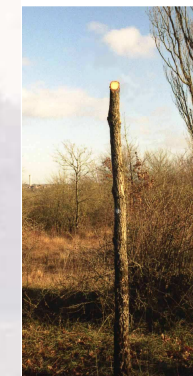
Baliveau après étêtage