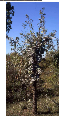
Baliveau au printemps suivant