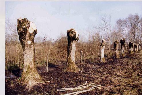
Alignement de têtards après bûchage