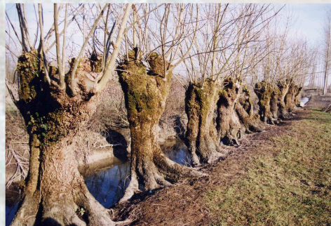
Alignement de têtards destinés à être bûchés dans quelques années