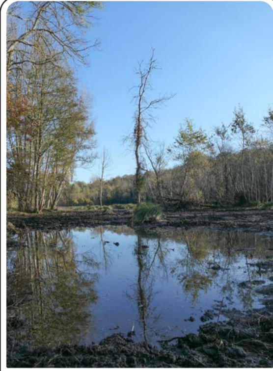
Affleurement de la nappe alluviale suite à l'étrépage des terrains, ce qui favorise l'accueil des oiseaux d'eau comme la bécassine des marais ou les aigrettes.