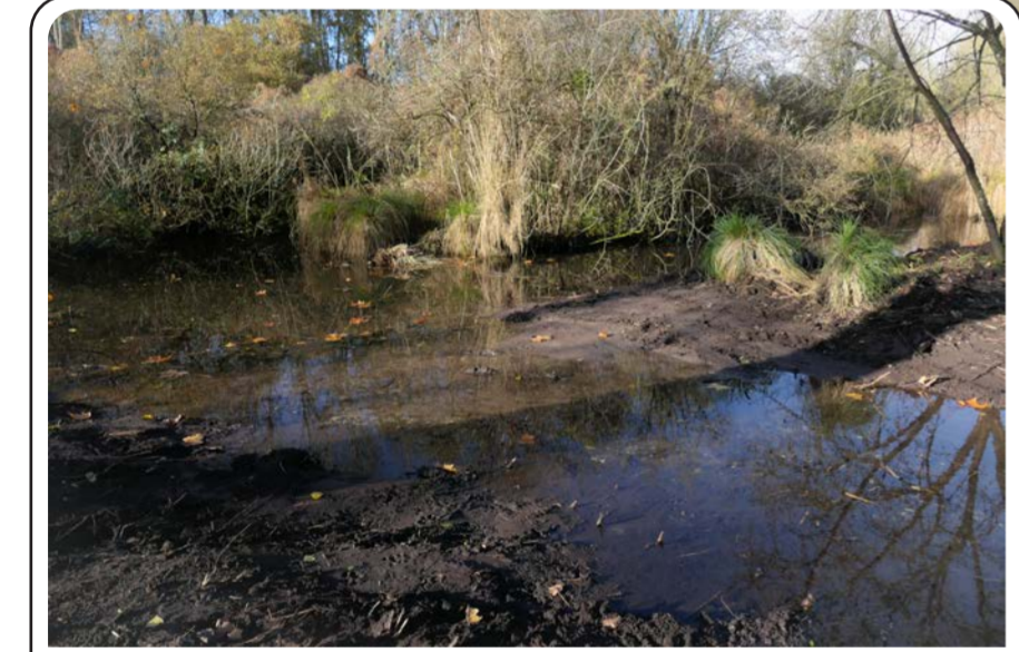
Création d'échancrures dans la berge pour restaurer la mise en eau du marais en période hivernale.

Maintien des touradons, formations végétales élevées, typiques des zones humides tourbeuses. Ils servent d'habitat à de nombreuses espèces comme le Vertigo de Des Moulins, escargot millimétrique, patrimonial dans la vallée de l'Essonne et classé vulnérable à l'échelle mondiale.