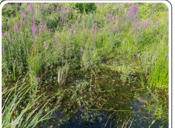
Herbiers en eau connectés au cours d'eau, propices à la reproduction du brochet.